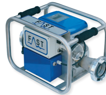
ZM mit DN 50 / DN 65 / DN 80