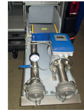
Auch als Festeinbau in Fahrzeugen