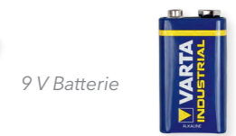
9 V Batterie