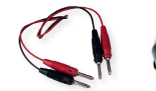
Verbindungskabel PipeMic® -Leitungssucher